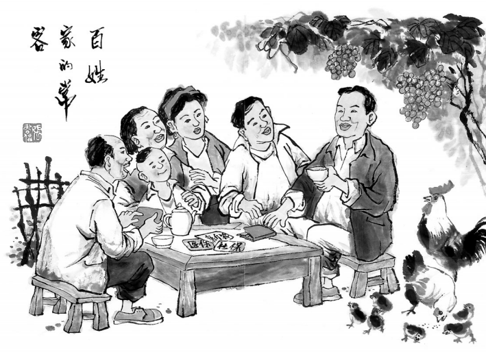
漫画 张书信 配文 陈新林

同时，金昌市纪委定期对信访形势进行综合分析，形成季度和年度信访举报综合分析报告，及时反映全市党风廉政总体情况和存在问题。针对发生在群众身边的腐败问题和扶贫领域涉腐问题，组织力量作为专题进行数据分析，为解决信访问题提供参考。